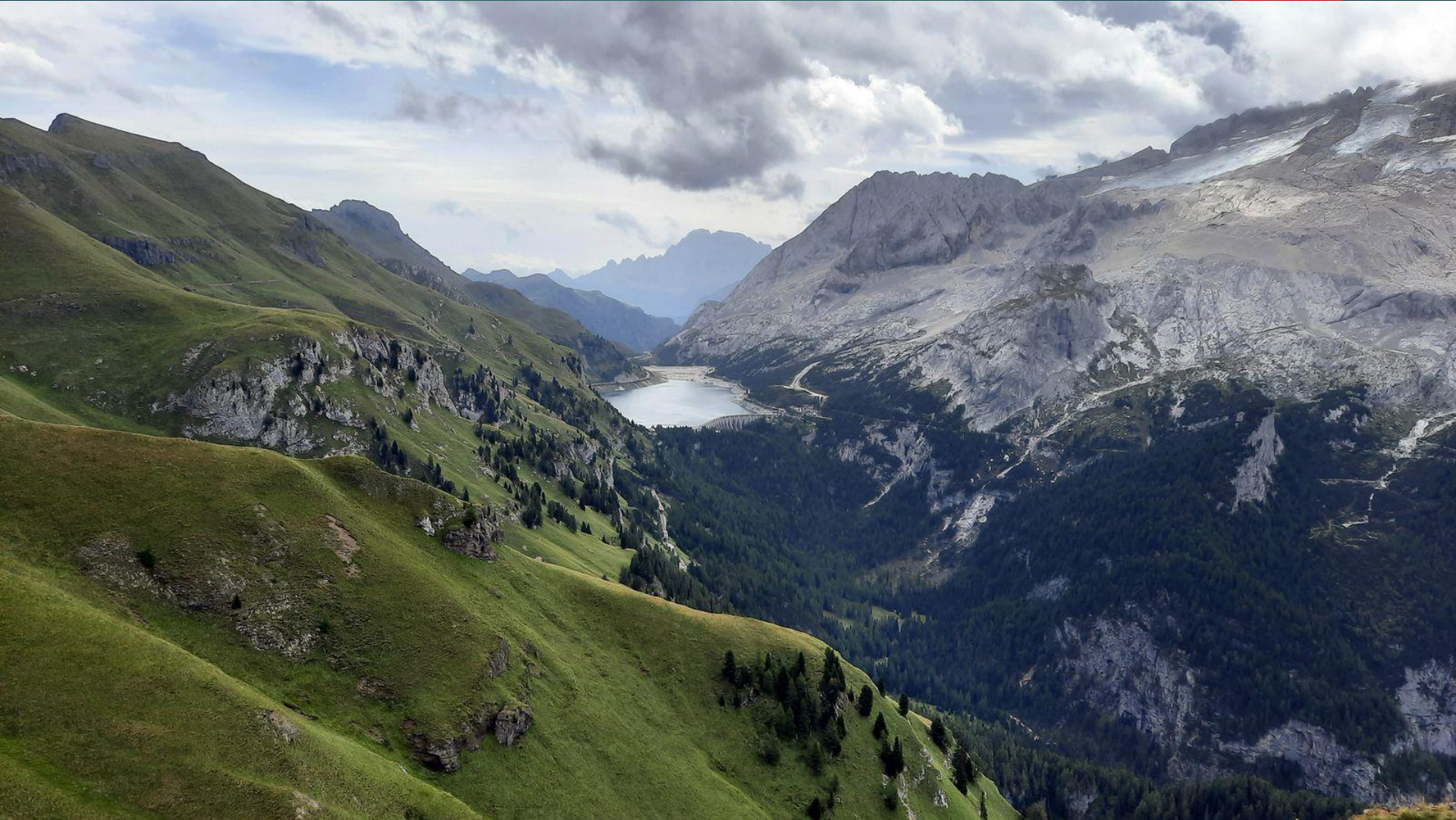
Lago di Fadaia, widok na resztki lodowca na Marmoladzie